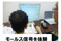
モールス信号を体験